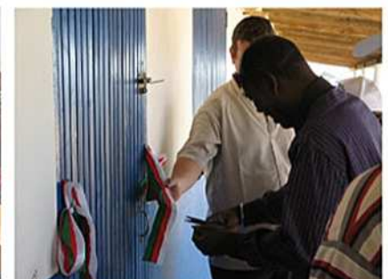
Inauguration du collège par les autorités le 24 septembre