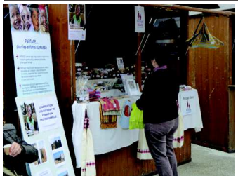
Nous étions présents sur des marchés festifs et sur des marchés de Noël