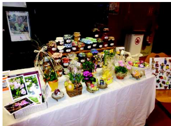
Nous avons été invités à un forum d'associations à l'EM de Strasbourg, et accueillis par le CE de plusieurs entreprises pour Pâques et Noël