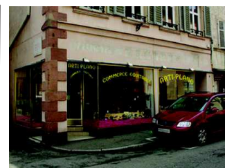
L'association amie Arti-Plano nous remet un chèque de 2500€

Le bâtiment est maintenant terminé et les élèves qui avaient commencé l'année dans des salles provisoires ont pu intégrer leurs locaux et sont maintenant dans des conditions optimales de travail.