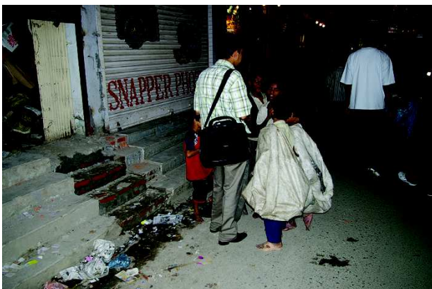
un éducateur en contact avec des enfants des rues.

Depuis sa création, VOC met en place un programme pour la protection des enfants vivant ou travaillant dans la rue. Elle a créé un Centre d'accueil (DIC) qui est installé dans un bâtiment en location. A la suite du tremblement de terre, le bâtiment du DIC, bien que n'ayant pas subi de gros dommages, n'est plus très adapté. En effet, les propriétaires de la maison vivent maintenant à l'étage supérieur de ce bâtiment et partagent la cuisine car la maison dans laquelle ils vivaient a été sévèrement endommagée. Ils peuvent de plus demander d'évacuer le bâtiment à tout moment.