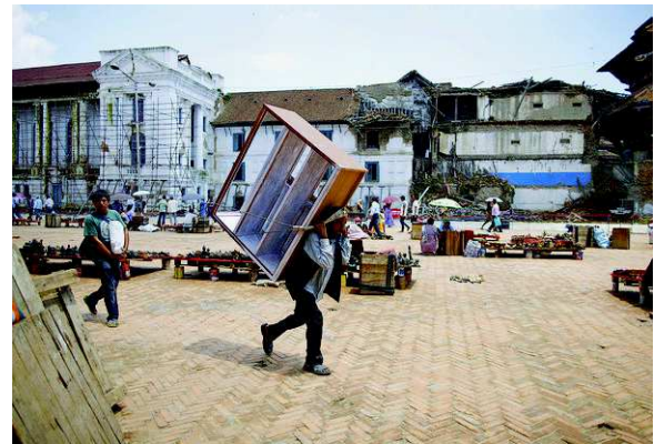
3 mois après le séisme, les travaux de reconstruction qui seront rapidement interrompus par la mousson.