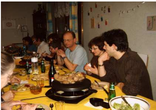
Autour d'une raclette

... 3 jeudis après-midi et 1 samedi pendant le mois de décembre nous étions présents au Village du Partage, place Kléber à Strasbourg . Après un début un peu décourageant, en se rapprochant de Noël les contacts se sont améliorés avec des rencontres et des ventes intéressantes.