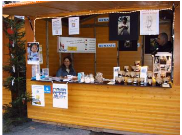
Le Village du Partage à Strasbourg