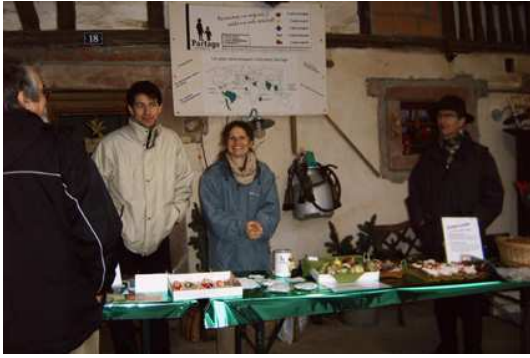
Le stand de la ferme Meyer

... 3 jeudis après-midi et 1 samedi pendant le mois de décembre nous étions présents au Village du Partage, place Kléber à Strasbourg . Après un début un peu décourageant, en se rapprochant de Noël les contacts se sont améliorés avec des rencontres et des ventes intéressantes.