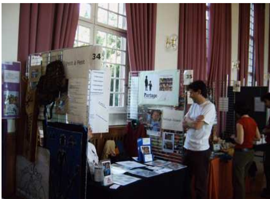
Dans le Hall du pavillon Joséphine lors du forum humani-terre

Contact avec le groupe des Kiwanis de Molsheim. Et aussi plusieurs journées d'agréables rencontres bricolage pour préparer des objets pour la vente.