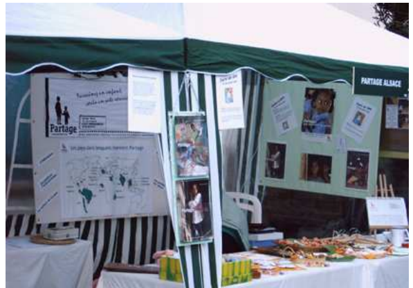
Vue de notre stand au marché de Pâques de Dachstein

Après un gros mois de décembre, un temps de rencontre amical nous a rassemblés en janvier autour d'une raclette bien méritée.