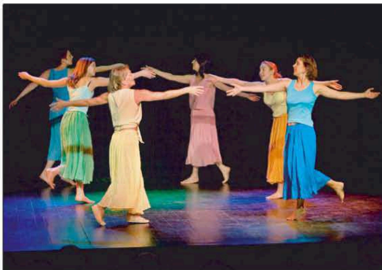
Le spectacle de Rythme et Danse

Le 11 novembre, l' ensemble vocal DIAPASON donnait un concert en l'église de Molsheim, au profit de notre projet au Népal. Le succès était au rendez-vous. Environ 650 personnes étaient venues les applaudir, l'église était pleine. Pour l'organisation de ce concert nous avons reçu le soutien et l'appui financier du Kiwanis Molsheim Bugatti.