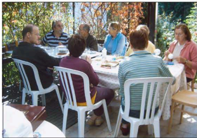
Travail dans la joie par un bel après-midi ensoleillé

Cette année encore nous étions présents sur le marché de Noël de Dachstein où le temps n'était pas de la partie (pluie et vent) et il y avait beaucoup moins de monde que les années précédentes.