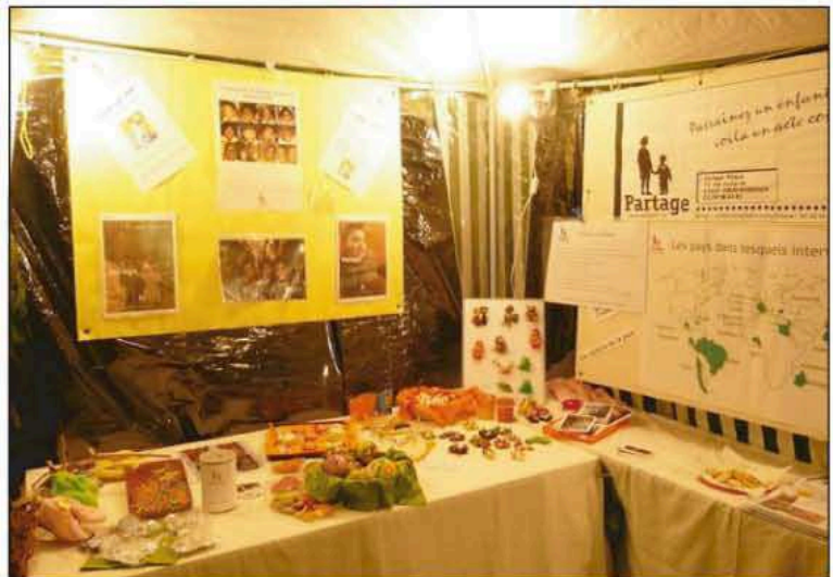
Notre stand au marché de Noël de Dachstein

Alors si le coeur vous en dit, n'hésitez pas à nous contacter, nous vous inviterons pour les prochains ateliers.