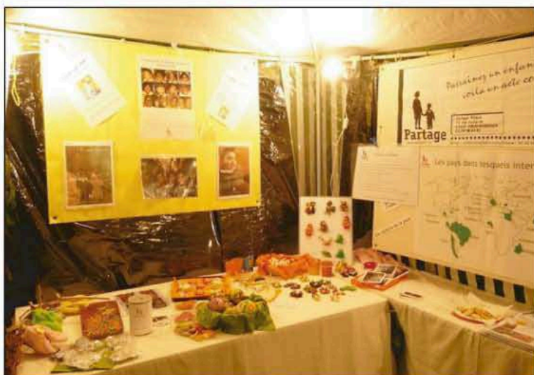
Notre stand au marché de Noël de Dachstein

Alors si le cœur vous en dit, n'hésitez pas à nous contacter, nous vous inviterons pour les prochains ateliers.