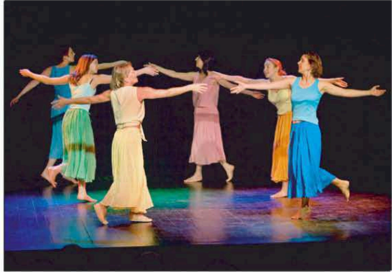
Le spectacle de Rythme et Danse

Le 11 novembre, l' ensemble vocal DIAPASON donnait un concert en l'église de Molsheim, au profit de notre projet au Népal. Le succès était au rendez-vous. Environ 650 personnes étaient venues les applaudir, l'église était pleine. Pour l'organisation de ce concert nous avons reçu le soutien et l'appui financier du Kiwanis Molsheim Bugatti.