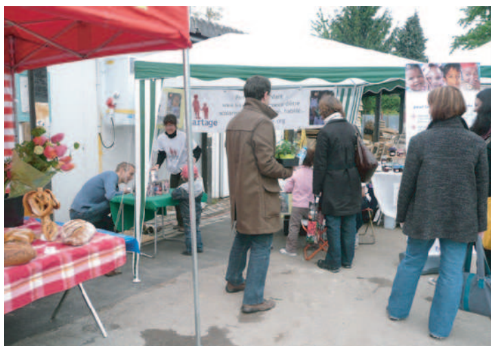
Notre stand à la journée portes ouvertes des JMV

Cela a également été l'occasion d'un nombre important d'articles dans les DNA et L'Alsace, et sur de nombreux sites internet.à