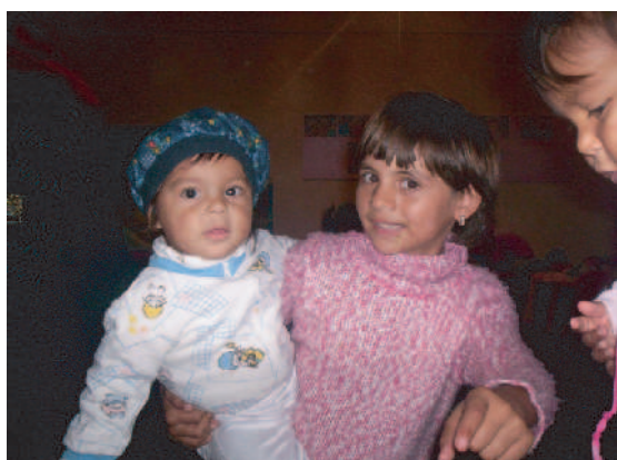
Portrait soeur - frère