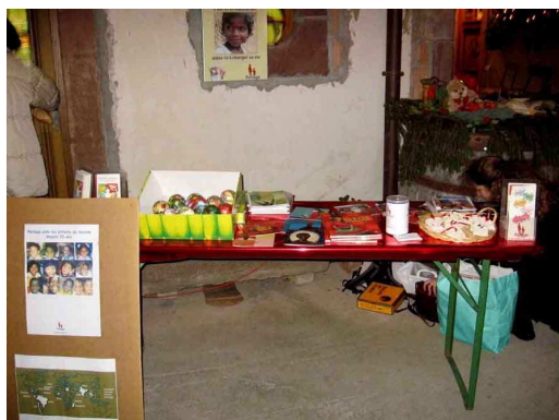
A la ferme une présence de quelques heures seulement et une préparation succincte

Encore une idée à retenir pour Noël prochain !